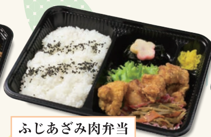
ふじあざみ肉弁当 550円