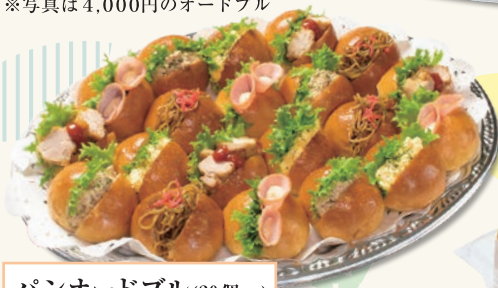
パンオードブル(20個~) 3,000円よりお作りします