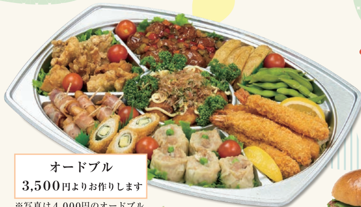
オードブル 3,500円よりお作りします ※写真は4,000円のオードブル