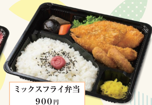
ミックスフライ弁当 900円