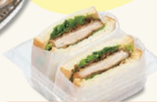
とんかつサンド 450円