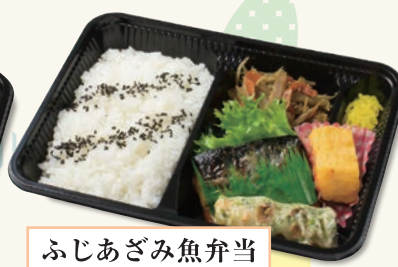
ふじあざみ魚弁当 550円