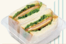
ハムカツサンド 450円